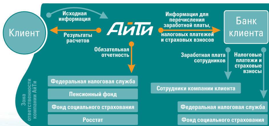
Схема взаимодействия с клиентом